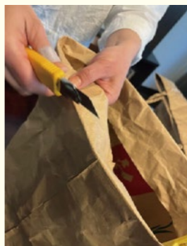
②バッグの縁に切り込みを入れ、編んだ持ち手を差し込みます