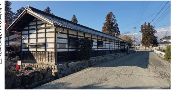
市有形文化財の長屋門