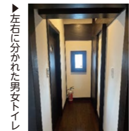
左右に分かれた男女トイレ