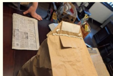
①マチの厚みに折り、接着します