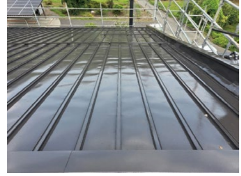
▲施工後(フッ素による塗装)