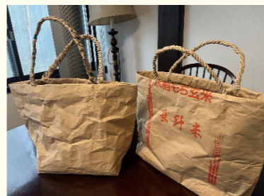
④左：袋を裏返したバッグ 右：文字を活かしたバッグ